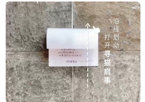
朋友圈投放页 H5外层