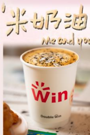
黑芝麻米奶油拿铁