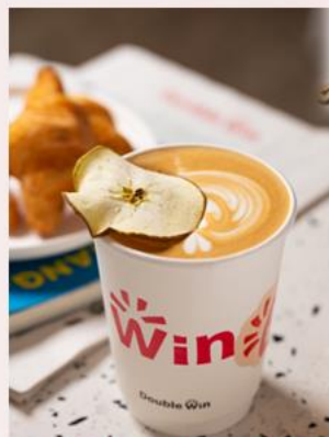
肉桂苹果米奶油拿铁