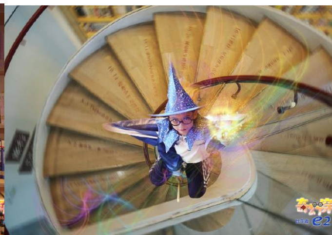
艺术空间玩转想象