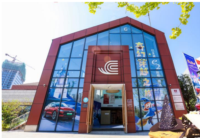
一座魔法纯电城堡

组合出兼具学习性、艺术感和体验感的 “魔法学院气质” ，亲子更易沉浸STEAM体验氛围