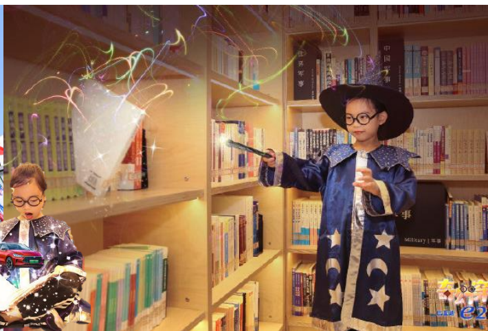
宝藏书库探索知识