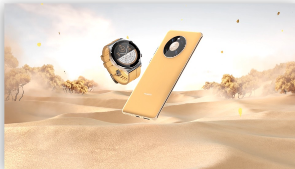
秋日胡杨-荒漠与探索