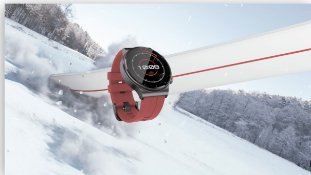
阳光甜橙-运动与激情