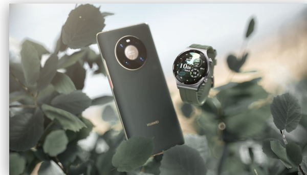
比斯开绿-生命与成长