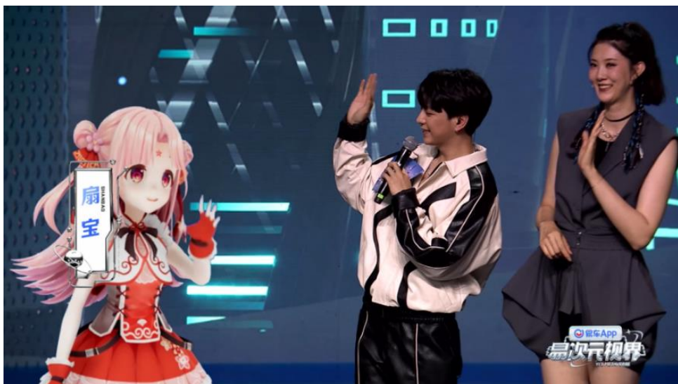
虚拟偶像“扇宝”与真人实时互动

易车针对不同的虚拟人应用了不同的动作捕捉与实时交互的技术方案，保障了直播中来自不同时空次元的虚拟人、真人，都能顺畅的在同一虚拟时空中进行表演，这种跨越次元合作，也为品牌带来了“破圈”营销的直播效果。