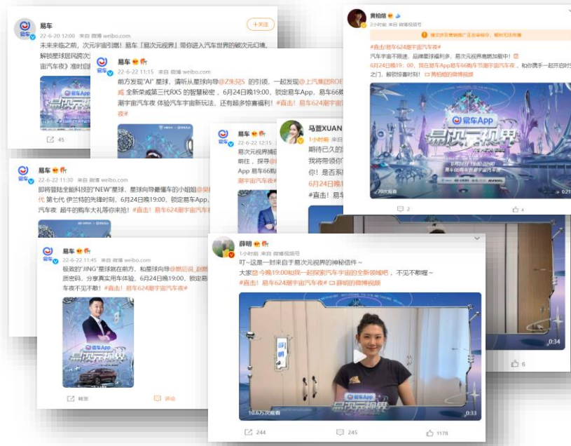
微博+全域社媒推广