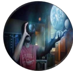
沉浸式 虚拟互联场景