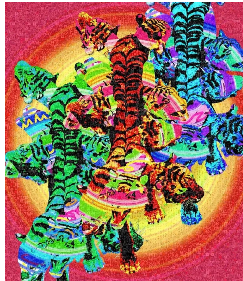
共铸作品《开明神虎》

这项艺术共创公益活动吸引了多位明星及上万名参与者。数字作品是将每一位参与者上传的头像，在著名当代艺术家邬建安画作《开明神虎》背景源图上匹配一个固定大小的像素块，并运用智能合成引擎进行二次创作，最终得到一张由上万个像素块组成的新的数字艺术作品。