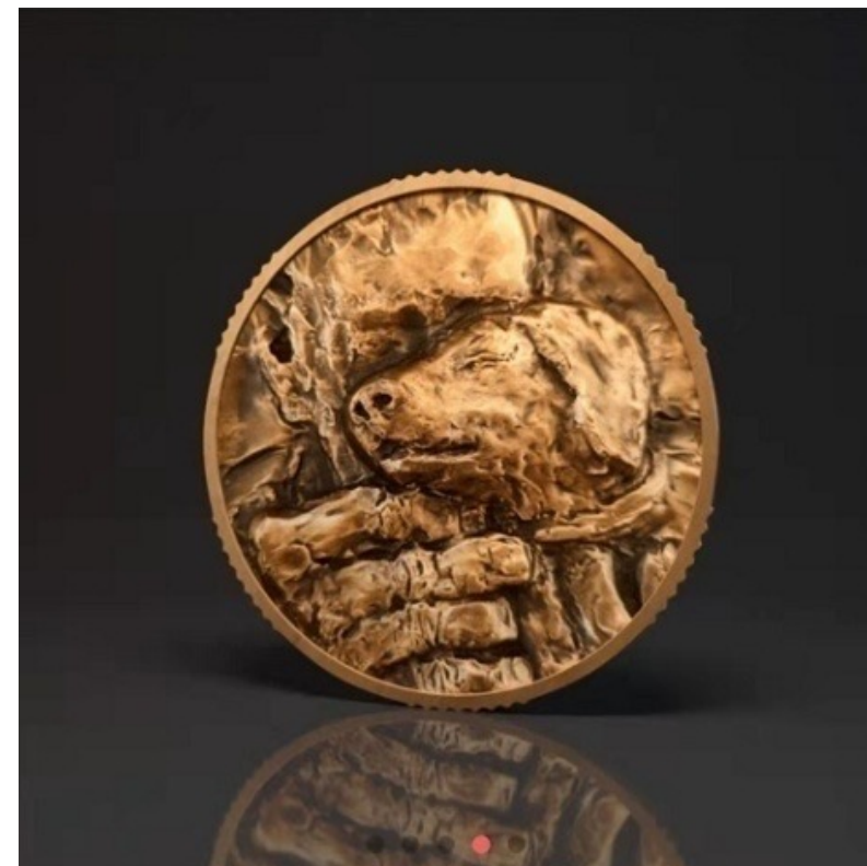
它基金十周年纪念数字徽章藏品

它基金是中国大陆第一个致力于动物保护的公益基金会。于2011年5月在北京市民政局注册成立，2014年被评为北京市AAAA级公益组织、2016年9月,它基金成为首批被北京市民政局认定为“慈善组织”的基金会之一。开展项目包括野生动物保护、流浪动物保护、动物保护理念传播以及推动动物保护相关的法律法规。