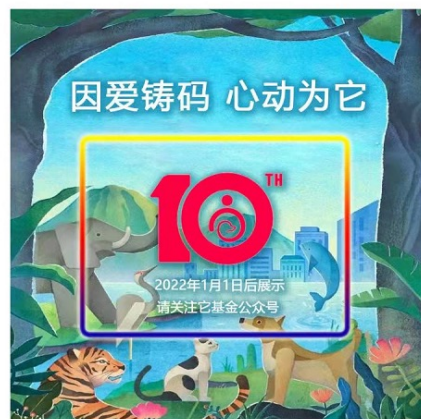
因爱铸码 心动为它