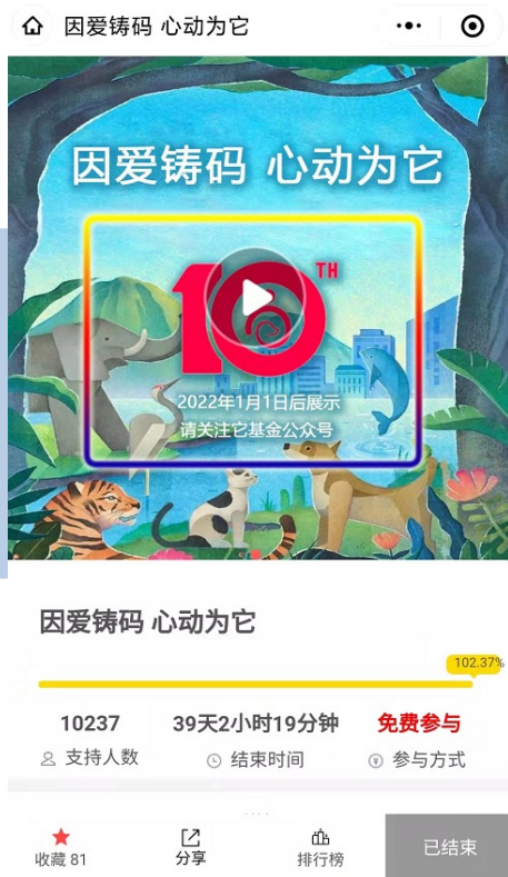
它基金成立10周年 因爱铸码活动