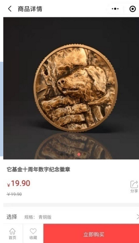
它基金 数字纪念徽章售卖页面