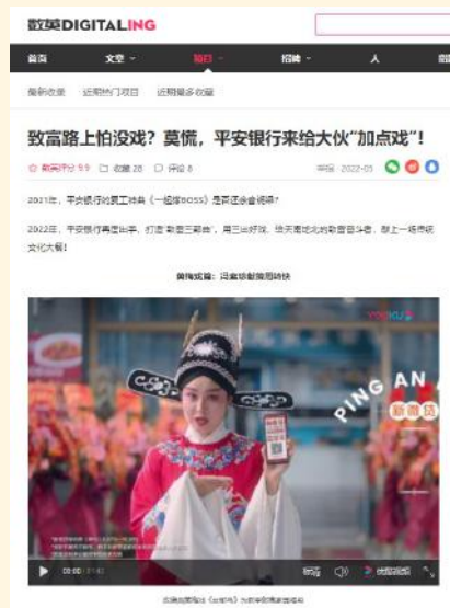
数英网项目复盘及用户评论反馈