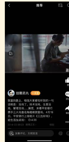
业内人气博主主动转发

本次项目再次打造金融业创新营销玩法，触动业内火热传播。通过数英网发布的复盘总结文章收获用户一致好评反馈，项目收获高分评价。梅花网发布项目视频后，入选作品周榜及作品新锐榜。首席品牌官更是发布项目干货长文，全面解读项目传播创意。除此之外创意视频还吸引了业内人气博主自主转发。