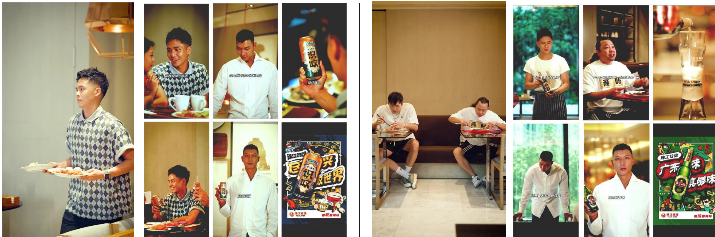
已上线故事短片 《识叹就有惊喜 珠啤当然懂你》