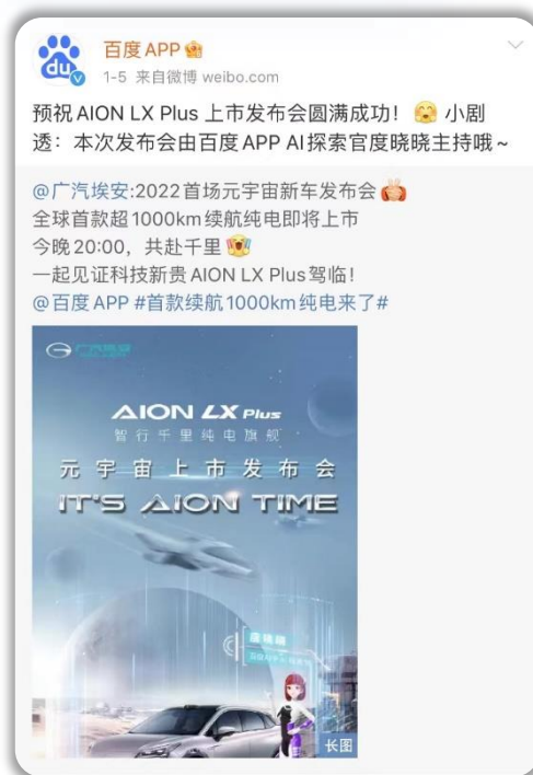
提前预热，预告发布会直播