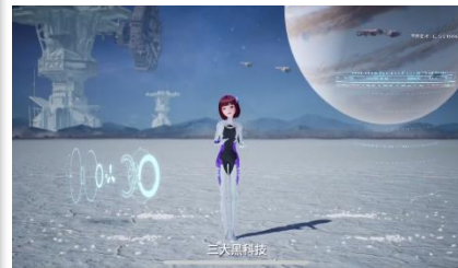
度晓晓生动解读新车卖点