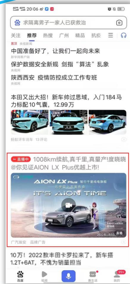
百度信息流GD 为发布会直播引流