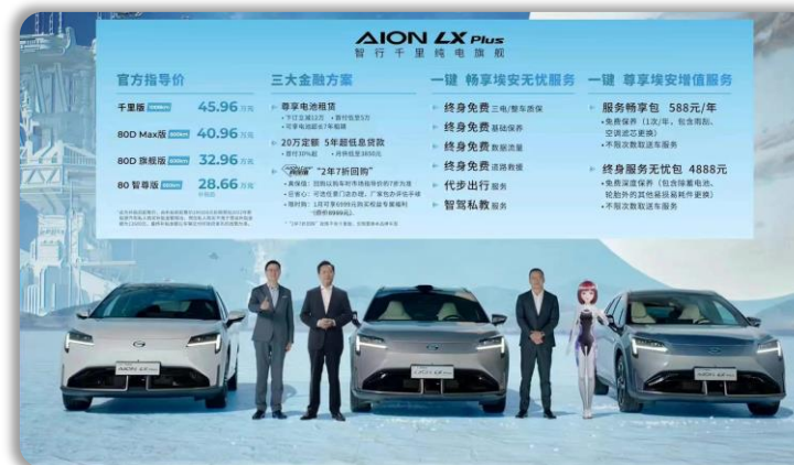
度晓晓与广汽埃安领导合影