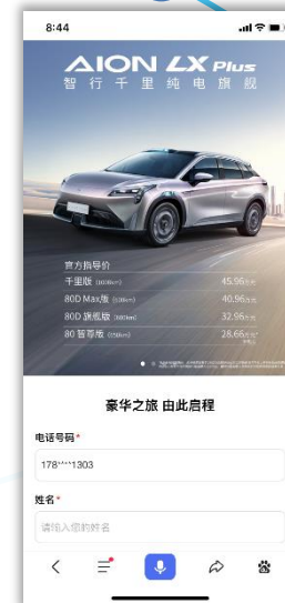
基本鱼留资页面 销售线索转化