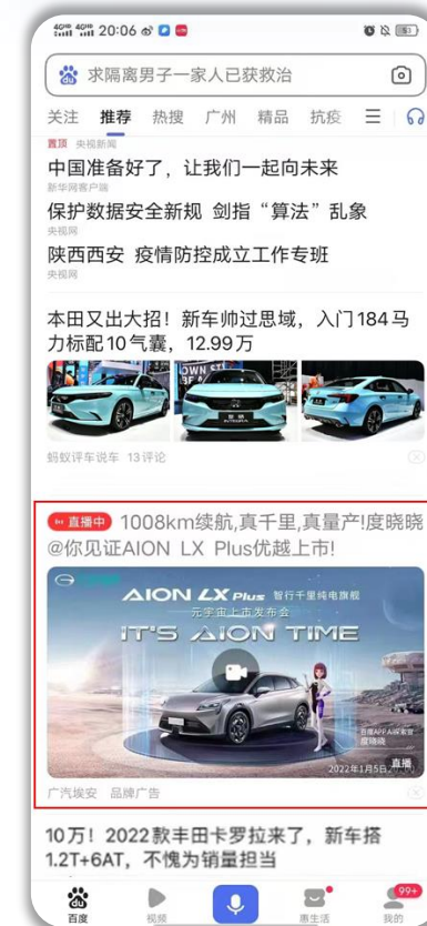
全量触达百度信息流人群 引流至发布会直播间