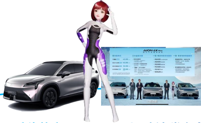
广汽埃安AION LX Plus新车发布会