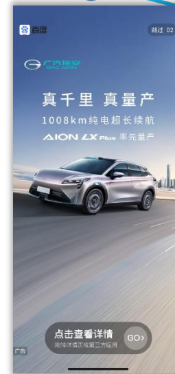
百度APP开屏曝光 新车上市热度延续