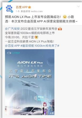
官方微博隔空互动 预告新车发布会